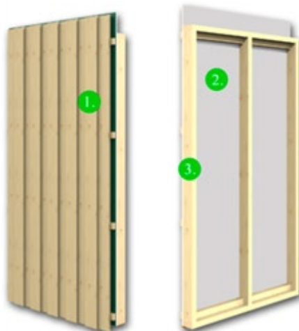
2. Lämmin seinä valmius