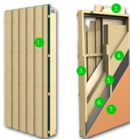
3. Lämmin seinävalmius +eristepaketti tarvike toimitus

Seinäelementti = 1200mm Pystyverhous kiinni elementissä / Vaakaverhous tarvike toimitus Kuvassa pysty Lomalauta elementti (18x120mm tai 20x120mm)