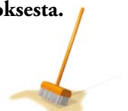
Lakaise pinnat puhtaaksi.