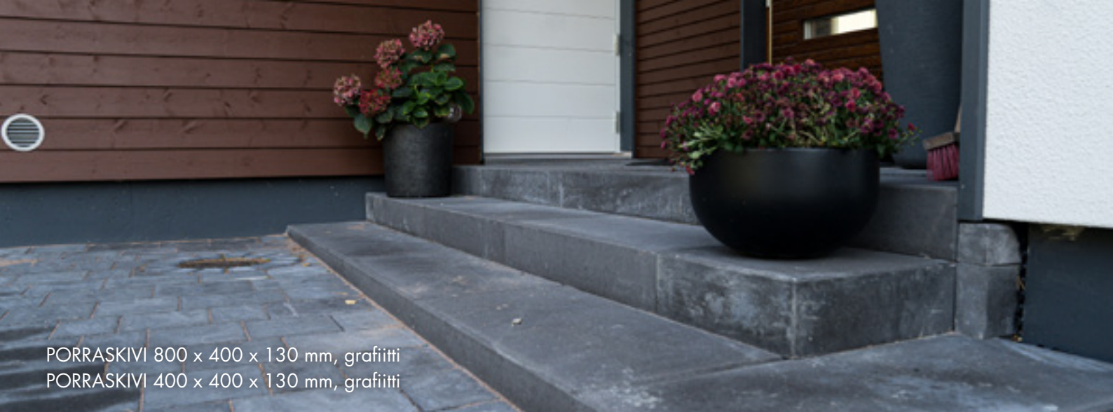
PORRASKIVI 800 x 400 x 130 mm, grafiitti PORRASKIVI 400 x 400 x 130 mm, grafiitti