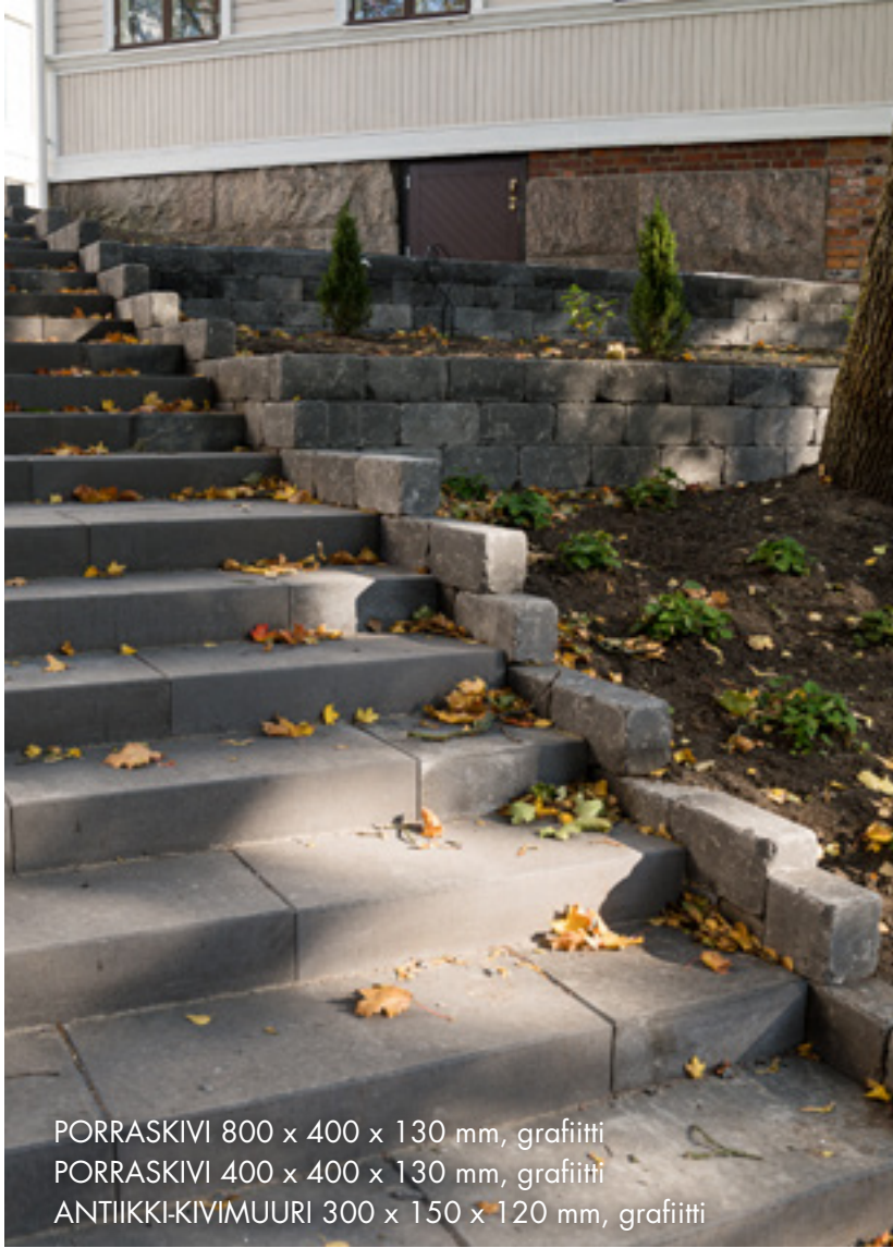
PORRASKIVI 800 x 400 x 130 mm, grafiitti PORRASKIVI 400 x 400 x 130 mm, grafiitti ANTIIKKI-KIVIMUURI 300 x 150 x 120 mm, grafiitti