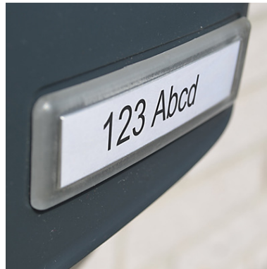
BOBI BELLA ja BOBI XPRESS malleissa on nimikilpi vakiovarusteena