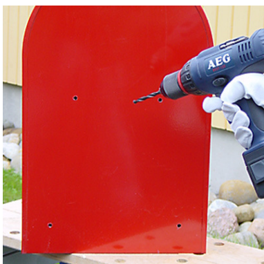
Lopuksi reiät puhdistetaan ja porausjätteet poistetaan huolellisesti esim. imuroimalla