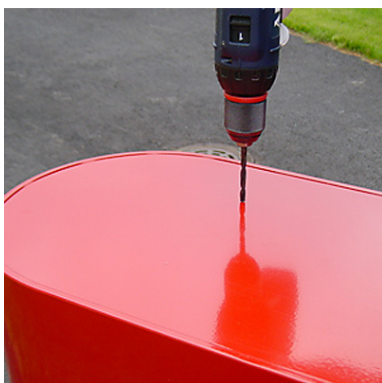
Pyöreäpäisten postilaatikoiden takaseinässä on valmiit kiinnitysreikien aihiot

Huom! Ennen kuin seinään tehdään reikiä varmistetaan, että sijaintipaikka sijaitsee juuri siinä missä pitääkin ja että täyttöluukut ovat postin suosittelemalla korkeudella.