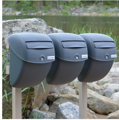
... tai postilaatikkoteline