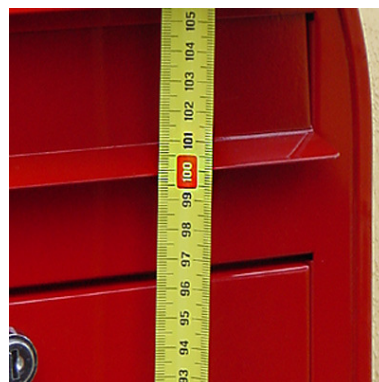
Varmistetaan, että täyttöluukun korkeus tulee postin suosittelemalle korkeudelle