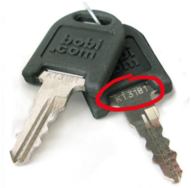
Lukon sarjanumero kannattaa kirjoittaa muistiin. Lisävainten tilaus: www.bobi.com