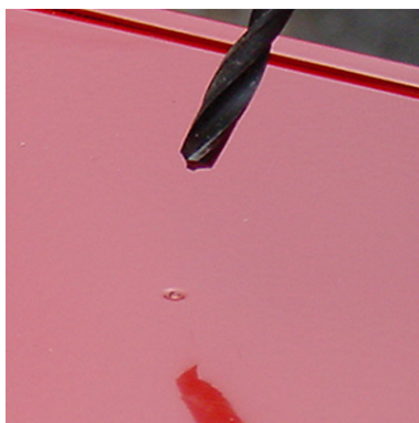
6 mm HSS metalliterä painetaan reiän aihioon...