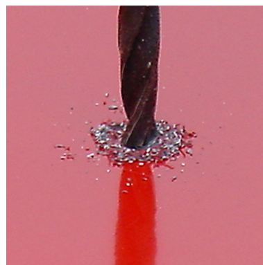
...ja porataan auki matalilla kierroksilla