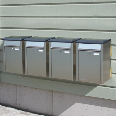
Asennuspaikka voi olla seinä tai aita