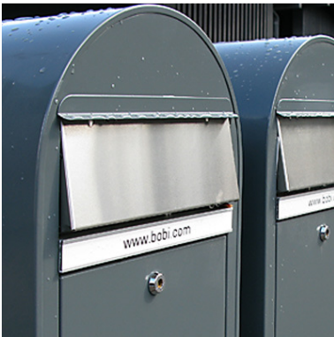
Postilaatikat kannattaa viimeistellä selkeillä nimikilvillä