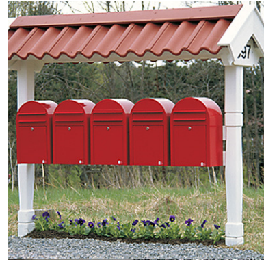
... tai postilaatikkokatos