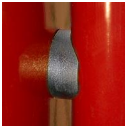
Osat ruuvataan kiinni toisiinsa postilaatikon sisäpuolelta