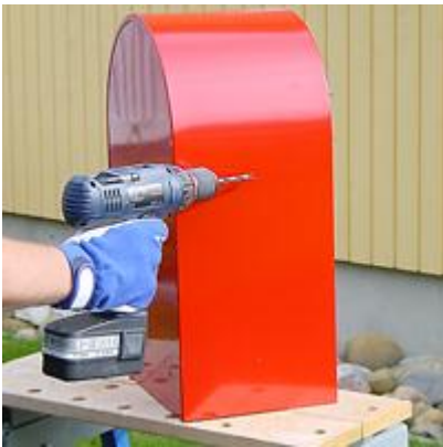
Postilaatikon sivuseinissä on valmiit kiinnitysreikien aihiot.

Mittatietoja asennusta varten löydät tästä