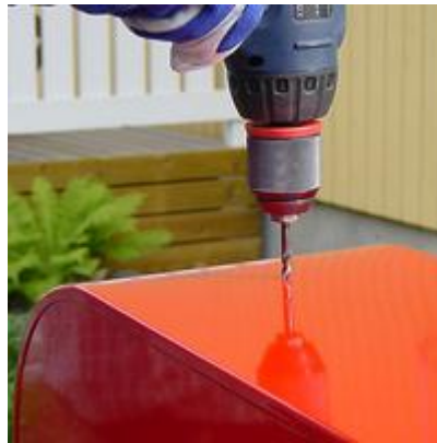
6 mm HSS metalliterä painetaan reiän aihioon...