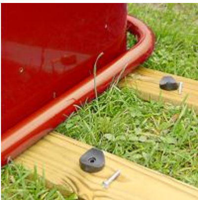
Postilaatikko, asennusjalusta ja kiinnitystarvikkeet otetaan esille.