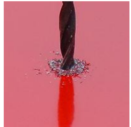
...ja reiät porataan matalilla kierroksilla. Reiät puhdistetaan ja porausjätteet poistetaan.