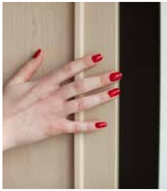
Soft-closing molemmilla puolilla aina vakiona.