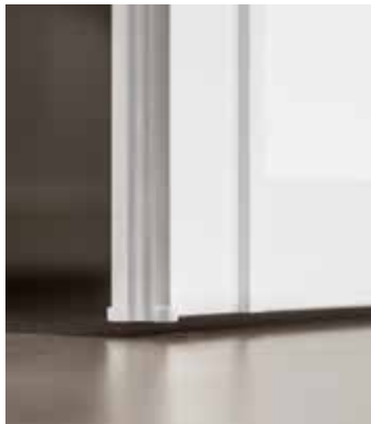
Yläkantoinen ovi - ikään kuin se kelluisi lattian päällä.

Estetic ja Artic - nyt myös ilman lattiakiskoa!