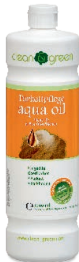
Aqua oil® -tehopuhdistusaine

Vaalealle öljytylle parketille suosittelemme aqua oil whitea.