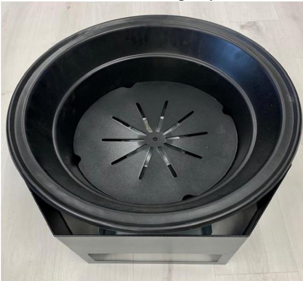
Kuva 8. Aseta arina grilliyksikköön.