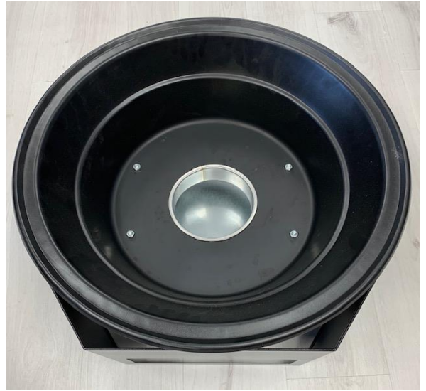
Kuva 7. Aseta tuhkanohjainholkki grilliyksikköön.