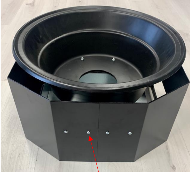
Ruuvi 6 x 16, 8 kpl