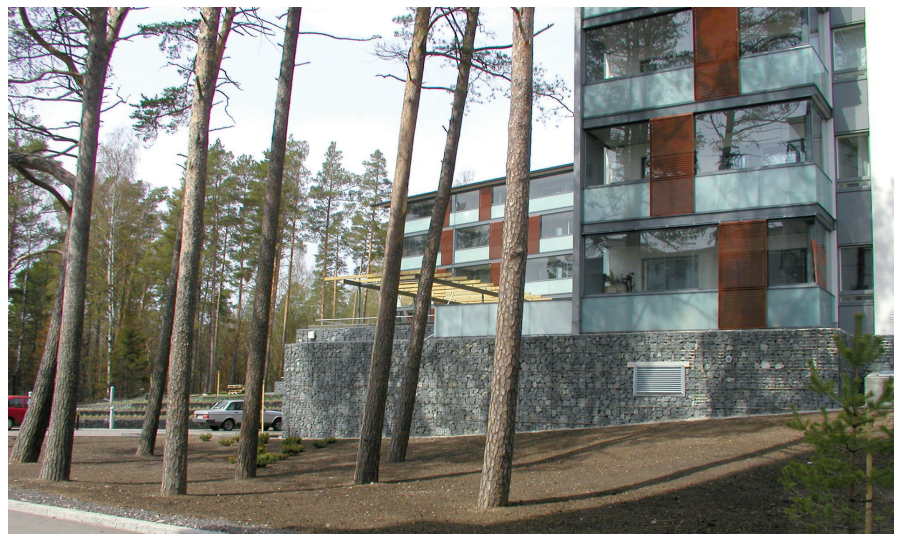
Vuosaaren taiteilijatalossa kivikoreja on käytetty julkisivuverhouksissa ja pihan pengerrakenteissa.

Vuonna 1989 perustettu Kaitos Oy on Suomessa alansa johtava geosynteettisten tuotteiden maahantuojana. Yrityksen toimintaan sisältyvät materiaalitöimitysten lisäksi myös tuotteisiin ja asentamiseen liittyvät asiantuntijapalvelut sekä projektiyksikön urakointi- ja rakennuspalvelut.