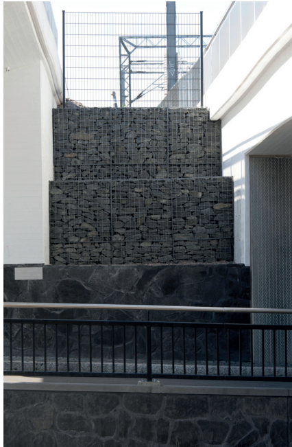
Valkoisenlähteentien alikulku, Vantaa