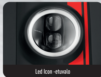
Led Icon -etuvalo