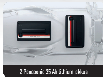
2 Panasonic 35 Ah lithium-akkua