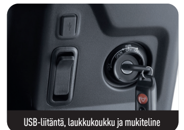
USB-liitäntä, laukkukoukku ja mukiteline