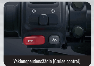
Vakionopeudensäädin (Cruise control)