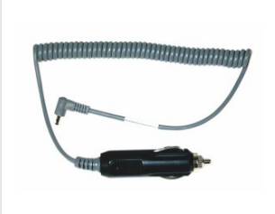
Til.nro 900507 Autolatausadapteri 12 V