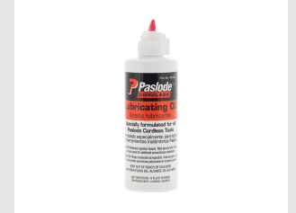
Til.nro 401482 Impulssinaulaimen voiteluöljy 115ml