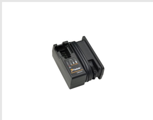
Til.nro 018881 Laturi Lithium- impulssinaulaimen akulle