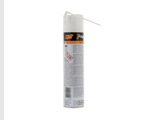
Til.nro 115251 Puhdistusspray impulssinaulaimiin 300ml