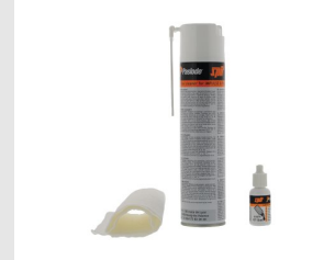
Til.nro 013690 Puhdistustarvikesetti, impulssi