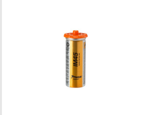
Til.nro 575722 2 minikaasupatruunaa (IM45CW / GN), blisteri