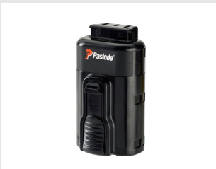
Til.nro 018880 Akku impulsseille, Lithium 7,2 V