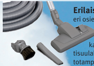
Erilaiset suulakkeet helpottavat kodin eri osien puhdistusta. Niillä imuroi tehokkaasti sohvanpäälliset, säleiverhot, kapeat raot ja muut hankalat paikat. Saatavana mm. erityinen parketisuulake koviille lattianpinnoille sekä mattotamppari mattojen tai vaikkapa patjojen imurointiin.

Letkujen vakiopituudet ovat 8, 10 ja 12 metriä. Esim. 8 metrin letkulla imuroi jo 100 m 2 .