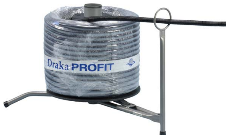
SSTL 64 070 09 MULTI-PURKUTELINE