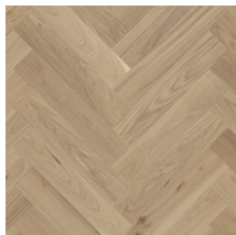
Segno Tammi Blonde