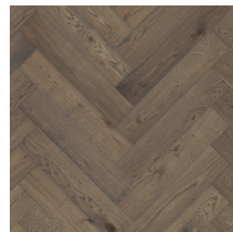
Segno Tammi Old Grey