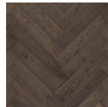
Segno Tammi Old Brown

Puu on luonnon materiaali, jossa esiintyy vaihtelua. Mallikuvien värit ja pinnan kuviot ovat viitteellisiä. Saat kattavamman käsityksen ottamalla yhteyttä jälleenmyyjään tai käymällä osoitteessa www.tarkett.fi . Myymälöissä voit tutustua Tarkettin lajitelmakuvakirjaan (grading book) ja aitoihin puunäytteisiin. Yksittäinen näyte on kuitenkin vain esimerkki siitä, miltä lattia voi näyttää. Jotta saat käsityksen koko lattian väri vaihteluista, oksankohtien määrästä ja muista ominaisuuksista, tutki useita lautoja tai tutustu lajitelmakuvakirjaan. Tämä on erityisen tärkeää, kun kyseessä on lankkulattia tai sävytetty lattia.