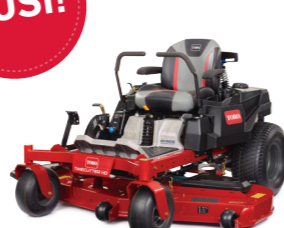
TIMECUTTER HD 122 cm · 137 cm