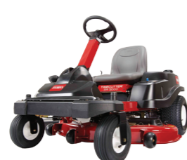
TIMECUTTER® SW 81 cm · 107 cm · 127 cm