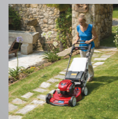
RECYCLER® 53 CM