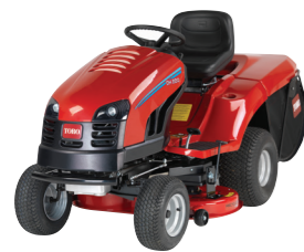
DH-SARJAN AJONEUVO 92 cm · 102 cm