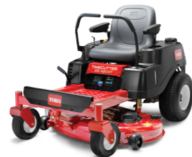
TIMECUTTER® ZS 81 cm · 107 cm · 127 cm