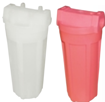
PP 10" Natural