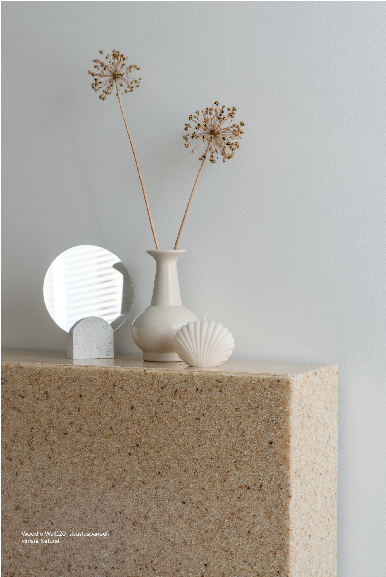
Woodio Wall120 -sisustuspaneeli värissä Natural.