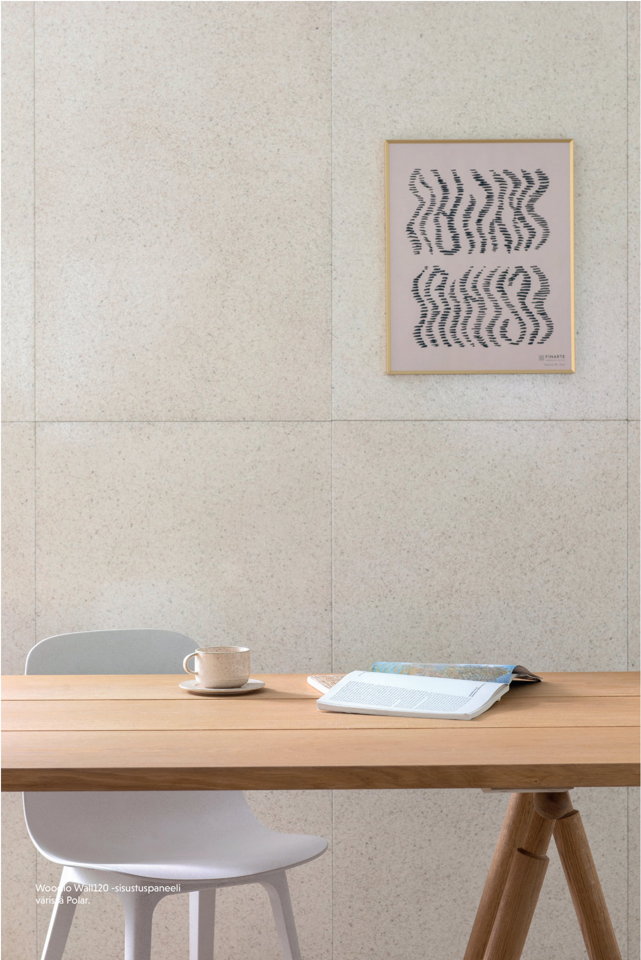
Woonio Wall120 -sisustuspaneeli värisä Polar.