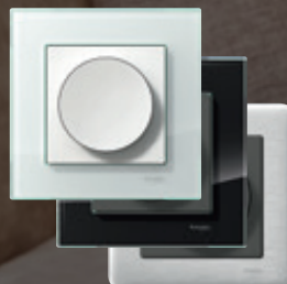
Exxact Solid Lasi- ja teräsvaihtoehdot