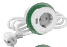
Pistorasia ja USB A