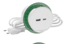
USB A- ja C-laturi