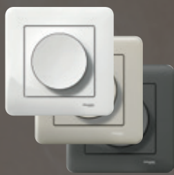
Exxact Primo Kaikenlaisiin sisustuksiin

Kun haluat nostaa olohuoneesi laatutasoa, älä unohda uusia sähkökalusteita. Exxact Solid korkealaatuiset lasi-kehukset kruunaavat tilan kuin tilan. Voit sommitella väri vaihtoehtoja keskenään, painikkeet ja kehykset voivat olla eri värejä.