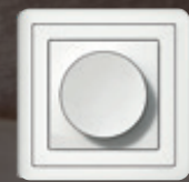
Exxact Combi Useita väri- ja yhdistelmä- vaihtoehtoja